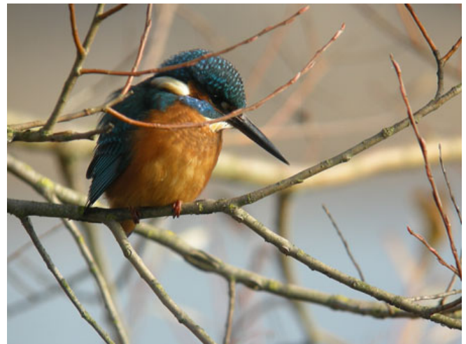
Martin-pêcheur d'Europe

Si les conditions météo particulièrement difficiles du mois de mai et les inondations qui s'en sont suivies ont permis de magnifiques observations de limicoles dans le val de Saône (en plumage nuptial, en plus !), elles ont déjà et vont sûrement perturber la nidification d'un grand nombre d'espèces. Retards, abandons ou échecs de reproduction risquent d'être nombreux. Si tous les oiseaux seront potentiellement touchés par cela, on peut craindre que certaines espèces nichant près de l'eau le soient encore plus durement : Guépriers d'Europe, Cincles plongeurs, Hirondelles de rivage et Martin-pêcheur d'Europe, pour ne citer qu'eux, ont probablement vu une part non négligeable de leurs nichées détruites par la montée des eaux qu'ont connue toutes les rivières du département. Il serait donc intéressant, dans les semaines qui arrivent, de suivre la nidification de ces espèces (et des autres !).