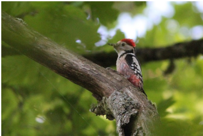
Pic mar

C'est au mois de juin qu'il est le plus facile de prouver la nidification des pics : les petits, encore dans les nids, sont maintenant assez grands, forçant les adultes à de très nombreux allers-retours pour nourrir. Mais surtout, ils sont très bruyants, et leurs cris de quémandages sont aisément repérables. C'est notamment vrai pour les espèces les plus communes en Côte-d'Or : les Pics vert , épeiche et mar . Une fois bien « dans l'oreille » la sonorité particulière de ces pépiements, vous devriez ainsi pouvoir localiser plusieurs cavités occupées. L'opération sera d'autant plus facile si vous avez déjà repéré plus tôt au printemps des mâles chanteurs territoriaux !