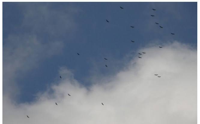
Vautours fauves

Chaque fin de printemps depuis une dizaine d'années, quelques individus en déplacements sont ainsi notés. Il semblerait que les secteurs vallonnés soient privilégiés par ce grand planeur durant son passage chez nous : arrière-côte de Beaune et vallée de l'Ouche, et dans un moindre mesure l'Auxois et le Châtillonnais, concentrent une grande part des mentions. Alors, pensez à lever les yeux au ciel dans les jours et semaines qui arrivent !