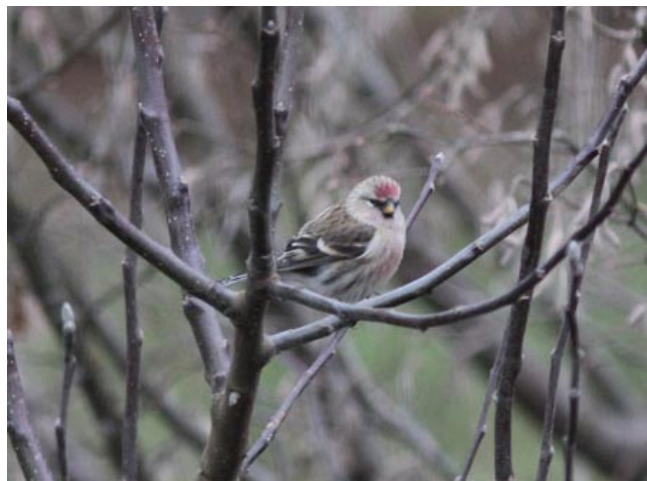
Sizerin flammé (G.Schneider)

Mais aussi 1 Bécasseau tacheté, 1 Bécassine double, 1 Busard pâle, 2 Ibis falcinelles, 2 Marouettes poussins, 2 Panures à moustaches, 1 Pouillot à grands sourcils, 1 très probable Pygargue à queue blanche, 1 Sterne arctique... et pas moins de 7 Rolliers d'Europe !!