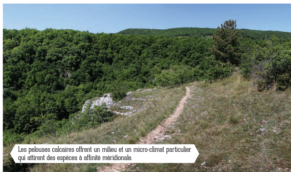
Les pelouses calcaires offrent un milieu et un micro-climat particulier qui attirent des espèces à affinité méridionale.

zizi, Fauvette grisette, Linotte mélodieuse, Hypolaïs polyglotte et Accenteur mouchet sont communs ; la Pie-grièche écorcheur et la Huppe fasciée sont plus rares. Il faut profiter de cet espace dégagé pour observer les rapaces : Buse variable, Bondrée apivore, Milan noir, Circaète Jean-le-Blanc, Faucons pèlerin, crécerelle et hobereau, ainsi qu'Épervier d'Europe ; et attendre le crépuscule pour entendre l'Engoulement d'Europe. Dans la pinède se rencontrent Mésanges noire et huppée, Roitelet huppé, et plus rarement le Bec-croisé des sapins. Le plateau entrecoupé de haies offre de belles situations d'observations de l'Alouette des champs et du Tarier pâtre.