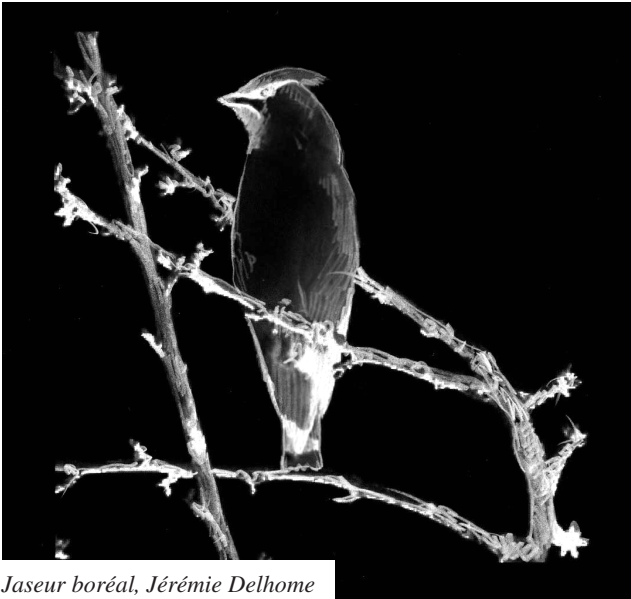
Jaseur boréal, Jérémie Delhome

Depuis un siècle et demi, date de la première publication ornithologique de Côte d'Or (Marchant, 1869), quelques incursions de cet oiseau nordique ont été enregistrées. Georges De Vogüé (1948) le signalait déjà comme "migrateur de passage irrégulier en hiver, sous la forme d'invasion de densité variable". Ainsi, en Côte d'Or, des jaseurs ont pu être observés de manière plus ou moins abondants aux hivers suivants : 1853-1854 ; 1866-1867 ; 1903-1904 ; 1913-1914 ; 1923-1924 ; 1941-1942 ; 1965-1966 ; 1967-1968. Exceptionnellement, quelques petits groupes isolés ont également été notés. Pour disposer d'informations sur la biologie, l'écologie, la répartition et le phénomène invasif, cf. Tiercelet info 14, le Jaseur boréal : invasion en cours .