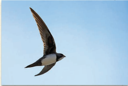
Martin à ventre blanc

À la belle saison, le ballet des Martinets à ventre blanc s'ajoutera à l'animation du vallon. Entre le