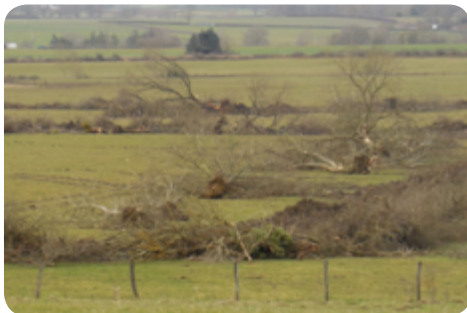
Destruction de bocage favorable à la Pie-grièche à tête rousse