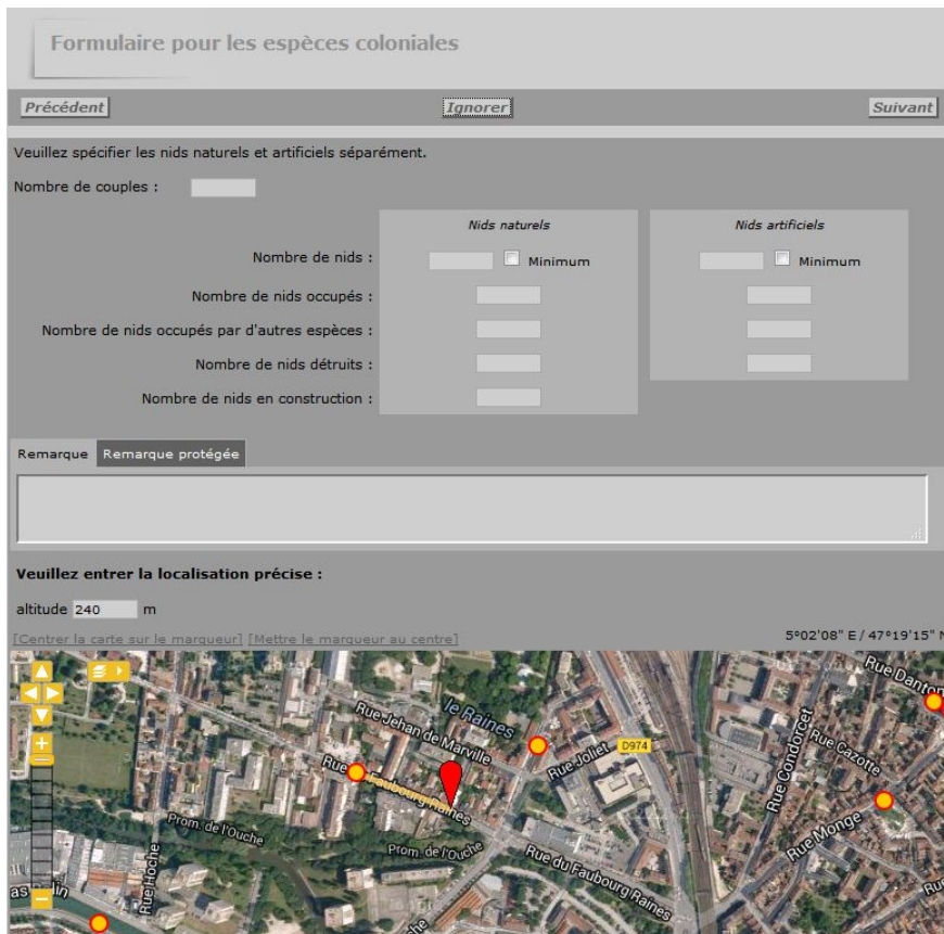
Figure 1 : Module espèces coloniales de Visionature

→ Si jamais vous souhaitez également inventorier les Martinets c'est possible ! Dans ce cas, utilisez directement www.oiseaux-cote-dor.org et le module « espèces coloniales ». Celui-ci s'ouvre automatiquement quand vous rentrez des observations d'espèces vivant en colonies (hérons, hirondelles, guêpiers, ...) avec un code atlas.