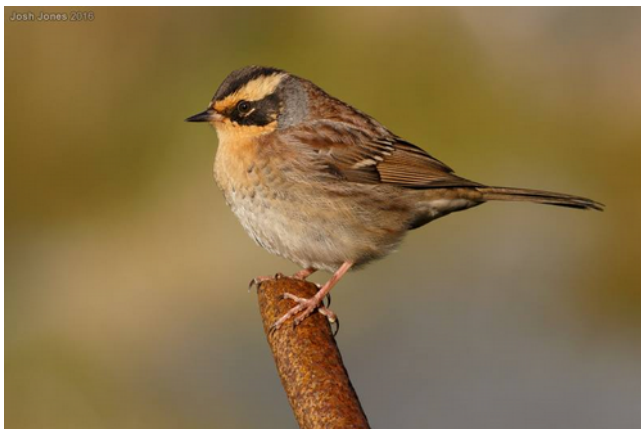
Accenteur montanelle, 10 octobre 2016, Shetlands

Ce cousin de l'Accenteur mouchet Prunella modularis ne pose aucune difficulté d'identification ; calotte et joues noirâtres, sourcils et gorge jaune-beige, dessus brun chaud, nuque grise... en plus d'être rarissime, il est magnifique !